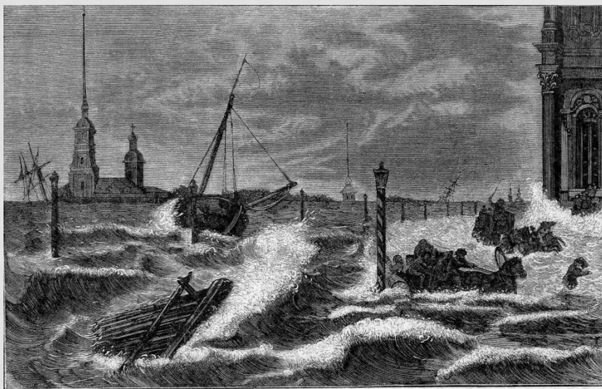
Наводнение в Петербурге в 1824 году, на Дворцовой площади.