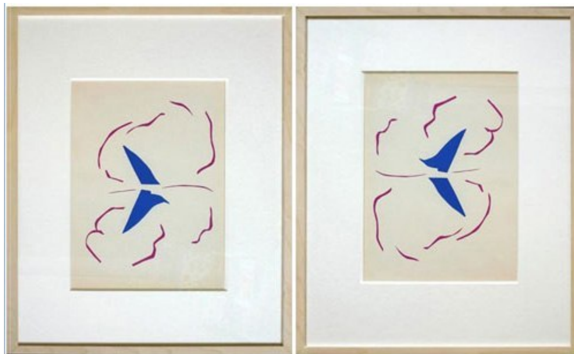
Анри Матисс “Лодка”