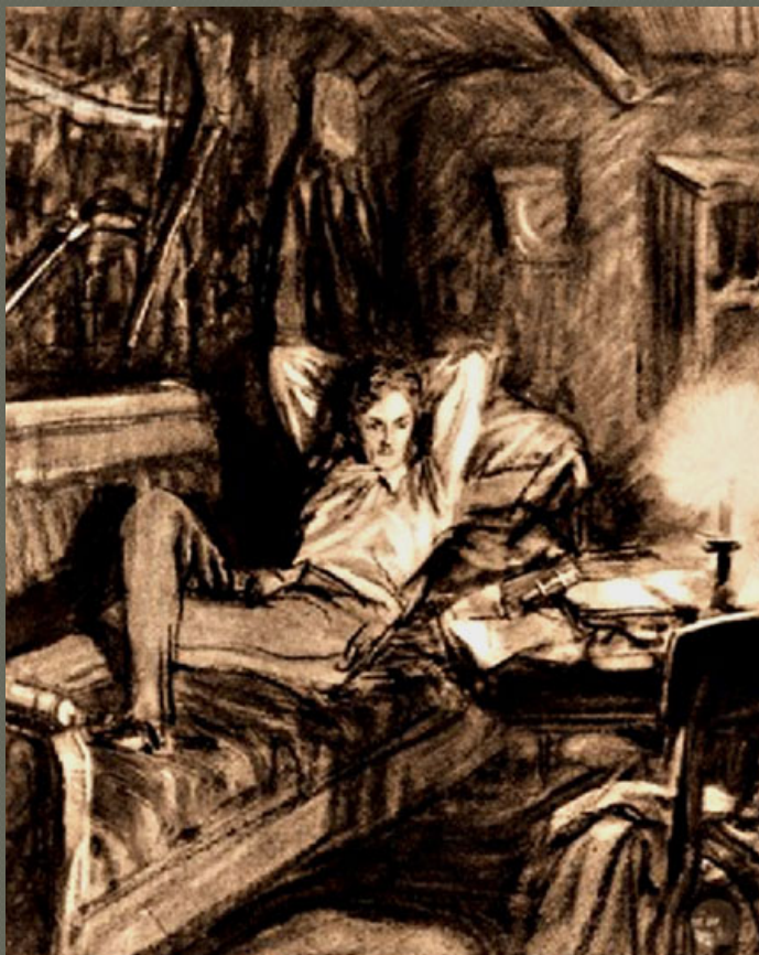
Печорин на диване. Художник Д.А. Шмаринов. 1941