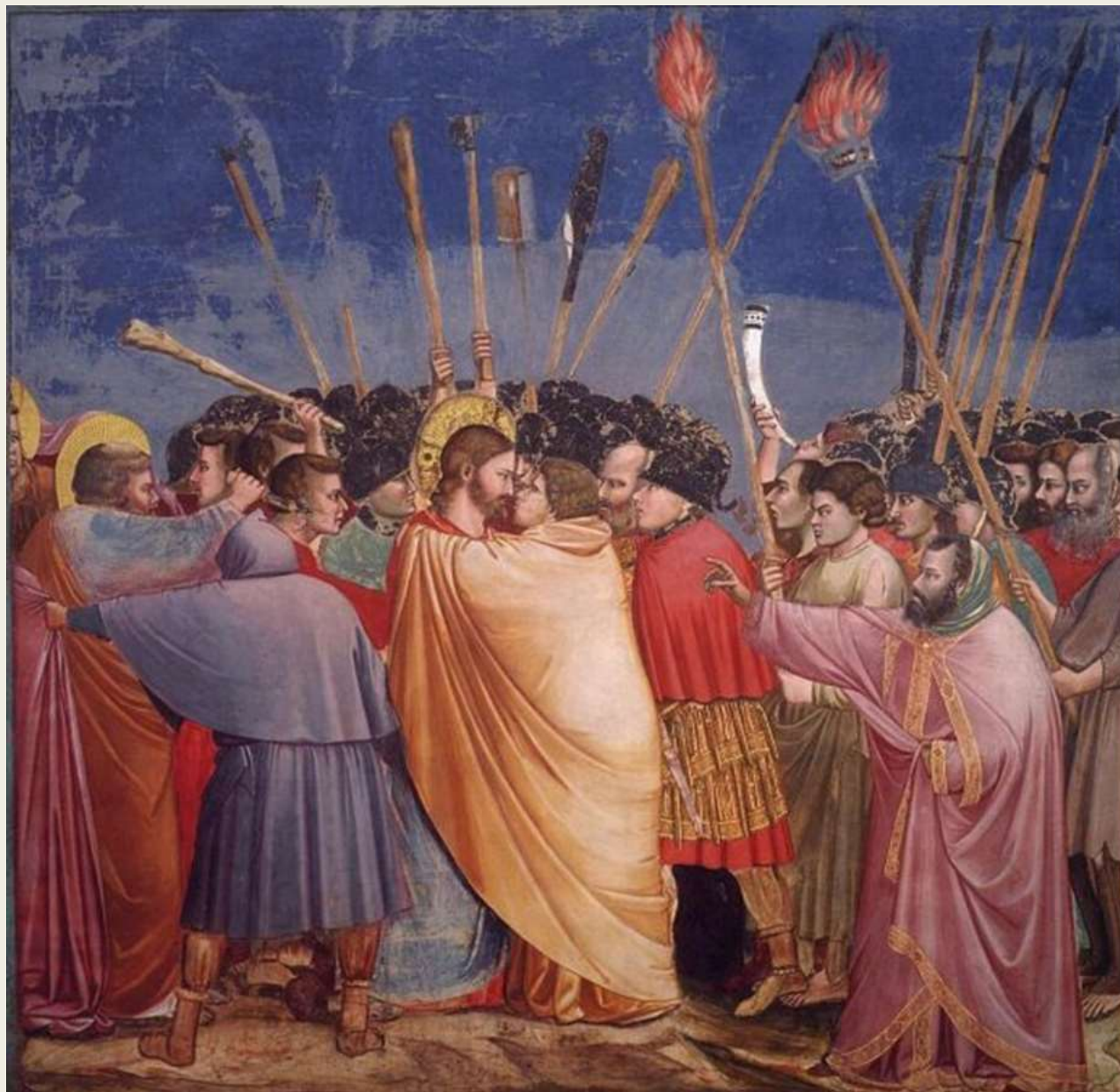
Джотто. Поцелуй Иуды. 1303-1305. Фреска в Капелле

До Малевича существовала другая азбука, придуманная ещё Джотто в начале XIV века. Эта азбука и была основой всего искусства. Это перспектива. Объём. Эмоциональная выразительность.